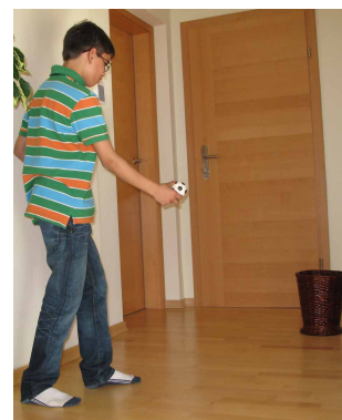
Abbildung 3: Versuchsanordnung zu Aufgabe 5

Die Aufgabe kann idealerweise fächerübergreifend mit dem Sportunterricht adaptiert werden. Ob Korbwürfe beim Basketball, Torschüsse beim Handball oder anderes, gelingen soll der Brückenschlag zwischen subjektiver Einschätzung und absoluter bzw. relativer Häufigkeit, um den Wahrscheinlichkeitsbegriff aus unterschiedlichen Blickwinkeln zu beleuchten. Gegenseitig positive Impulse der beiden Fächer können genutzt werden, um auch im weiterführenden Stochastikunterricht immer wieder auf eigene Ergebnisse der Schüler/innen aus dem Sportunterricht zurückgreifen zu können und damit authentisches Datenmaterial mit direktem Bezug zu den Lernenden einsetzen zu können.