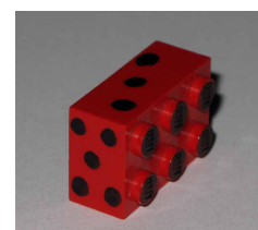
Abbildung 2: Legosteine-Würfel

Wurfresultate in einer Tabelle fest. Vergleicht eure Resultate!